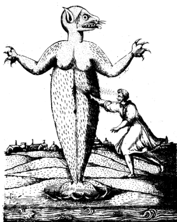
Figura 2. Gravura reproduzindo o monstro marinho de Gândavo e a forma como foi capturado.

Em relação a este último excerto, em que Gândavo volta a descrever a existência de monstros marinhos e demónios, é de chamar a atenção que o autor refere que o monstro “já é conhecido em outras partes do mundo”. Assim sendo, o termo monstro pode não estar necessariamente relacionado com uma criatura mítica ou imaginária, um ser do mal resultante do imaginário colectivo, mas sim associado à ocorrência de uma enorme criatura marinha assustadora. Neste caso, e com os conhecimentos biológicos actuais, podemos dizer que o animal descrito neste relato seria um leão-marinho da família das otárias. Estes também são conhecidos por focas com orelhas, por possuírem ouvido externo, ao contrário das chamadas focas verdadeiras, e esta característica está claramente representada na gravura que acompanha a descrição (ver figura 2). Por outro lado, os membros desta família podem deslocar-se em terra, utilizando tanto os membros anteriores como os posteriores, podendo ainda erguer-se com facilidade (sobre as características morfológicas das focas e leões-marinhos ver Reeves et al. , 2002: 51-57). Mais uma vez, pode ver-se na imagem que o animal está na vertical sobre as suas barbatanas traseiras, o que é outro indicativo do grupo biológico em questão.